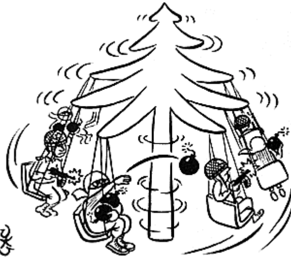
Hezbollah et armée israélienne au Sud-Liban

Le 17 mai 1999, les électeurs israéliens ont choisi l'alternance en élisant Ehoud Barak, le candidat du Parti travailliste, au poste de Premier ministre avec 56% des voix, infligeant ainsi une défaite cuisante au chef du gouvernement sortant, Benyamin Nétanyahou. Le vainqueur devra rapidement redynamiser un processus de paix qui s'est dangereusement embourbé durant les trois années passées. Cette relance devra s'effectuer dans trois directions.